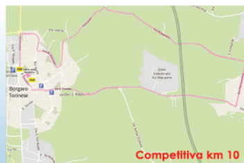
Competitiva km 10

PRIME PARTENZE GIOVANILI ORE 09.00 a seguire PARTENZE ADULTI ORE 09.40